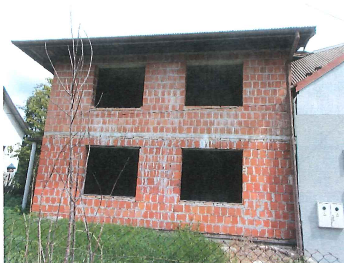
Elewacja zachodnia budynku