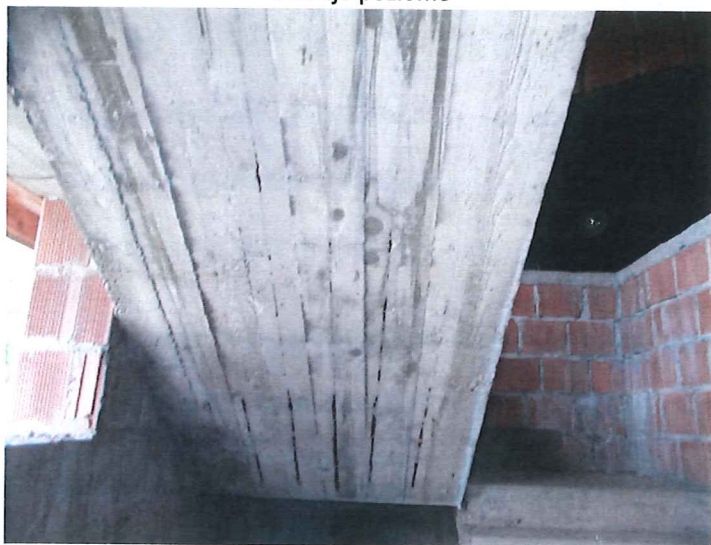
Zbrojenie biegu schodowego