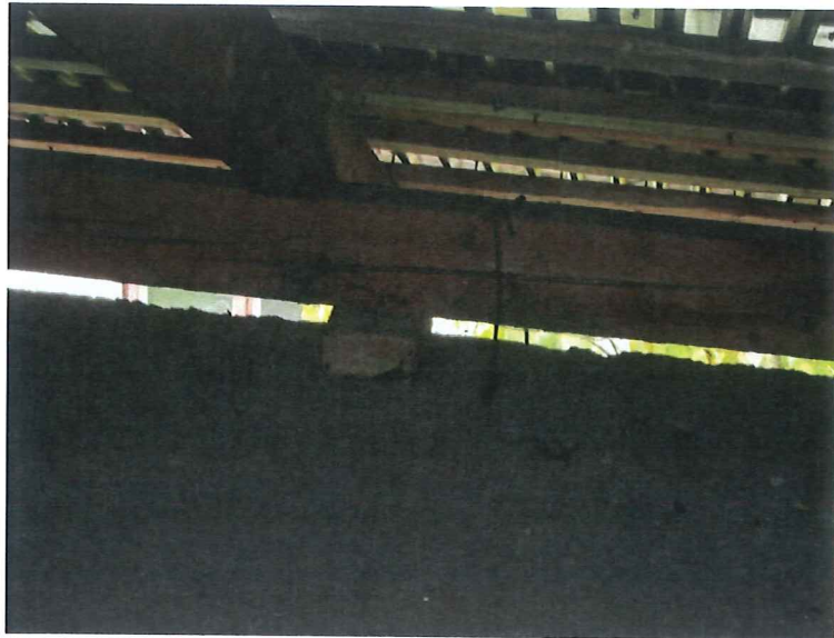
Szczegół mocowania płatwi