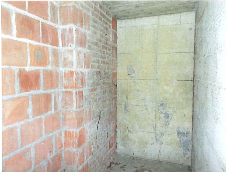
Piętro – pozostawiony otwór komunikacyjny