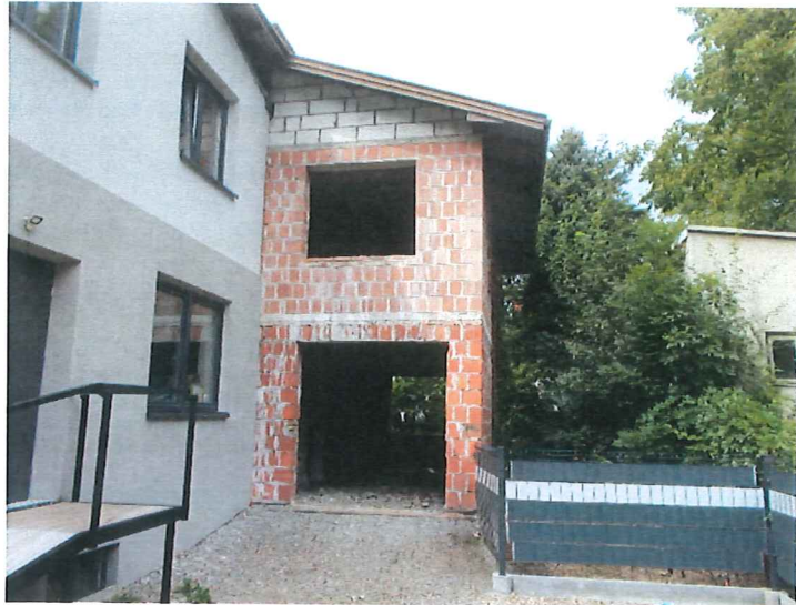
Widoczny fragment południowej elewacji